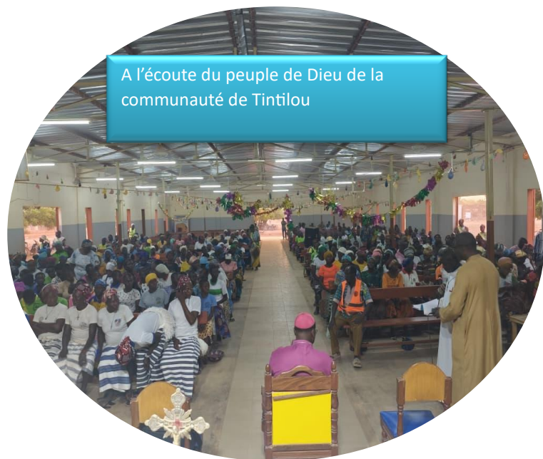
A l'écoute du peuple de Dieu de la communauté de Tintilou