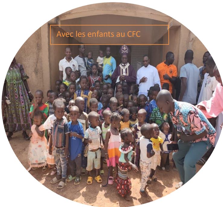
Avec les enfants au CFC