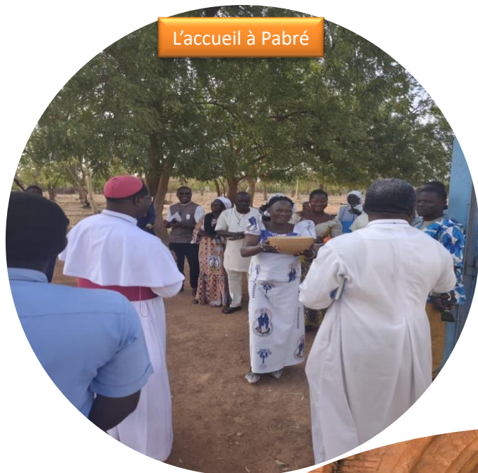
L'accueil à Pabré