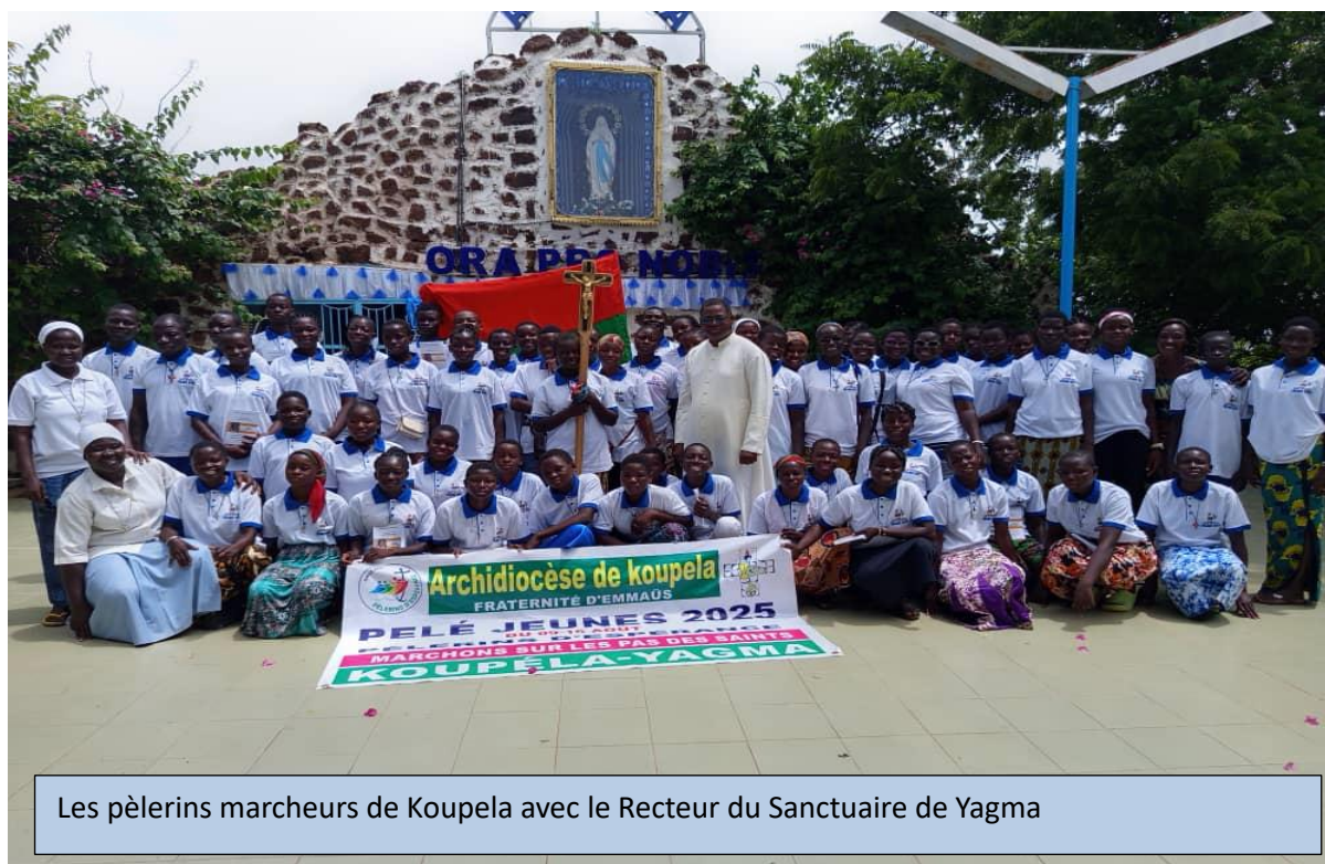
Les pèlerins marcheurs de Koupéla avec le Recteur du Sanctuaire de Yagma

Les pèlerins, venus de divers horizons, ont exprimé leur joie de confier leurs vies, leurs familles et leur pays à l'intercession maternelle de la Vierge Marie. Cette année, une particularité a marqué le pèlerinage : plus de soixante pèlerins (Jeunes-enfants) sont arrivés de Koupéla à pied, témoignant d'une foi vive et d'une grande détermination.