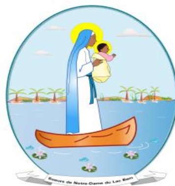
le logo des NDLB

Le Charisme des NDLB est l'annonce de la Bonne Nouvelle dans les régions rurales sans exclure les villes.