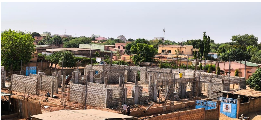
La Paroisse Saint Charles Lwanga de Wayalghin en chantier

nous disons merci et que Dieu fortifie chacun dans sa foi. Tous unis, pour bâtir notre Eglise Famille !