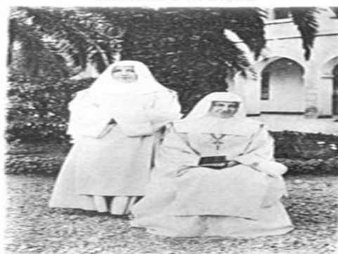
Congrégation des Sœurs Missionnaires de N.-D. d'Afrique

Elles ne restent pas dans leur pays, mais par l'intermédiaire de la Congrégation, elles sont envoyées dans d'autres pays d'Afrique pour l'annonce de la BONNE NOUVELLE DE JÉSUS-CHRIST en collaboration avec les Églises locales. Les sœurs blanches poursuivent la mission aujourd'hui dans quatre orientations apostoliques à savoir :