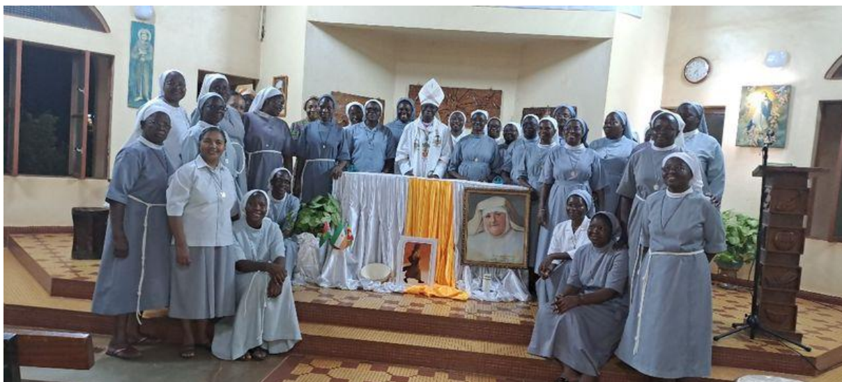
Des sœurs FMM a la fin d'une Assemblée