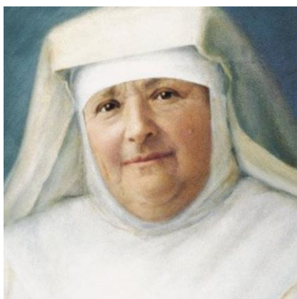
Bienheureuse Marie de la Passion, fondatrice des FMM