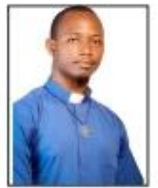
Ab. KOALA Hermann