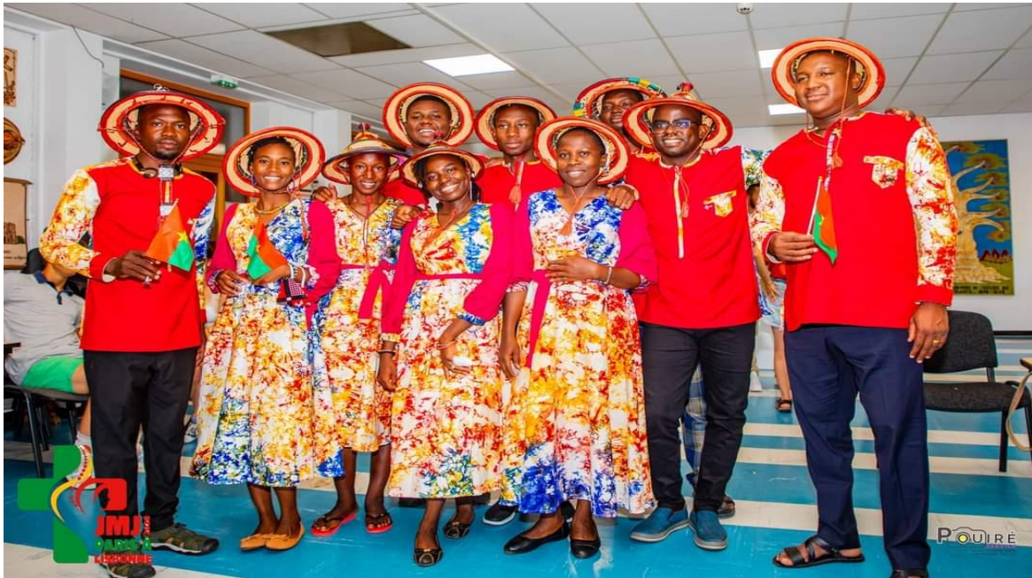
Vive Jésus Christ. Vive le pape ! Vives les JMJ